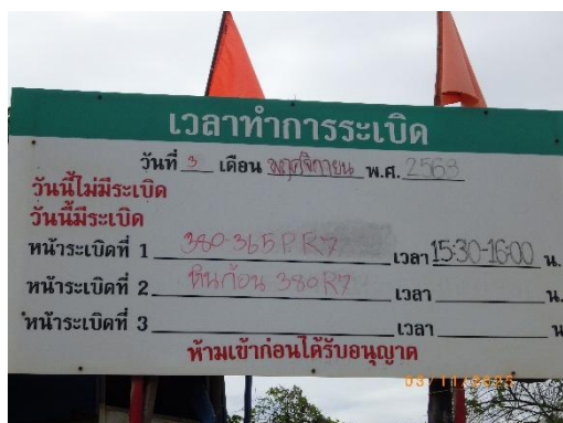
รูปที่ 2-6 ป้ายแจ้งวัน-เวลาระเบิด

ร่วมแผนผังโครงการทำเหมืองเดียวกันกับประทานบัตรที่ 27342/15021 27343/15028 27347/14975 27349/15029 27350/15022 และ 27362/15027 ของบริษัท ทีพีโอ โพลีน จำกัด (มหาชน) ระหว่างเดือนกรกฎาคม-ธันวาคม พ.ศ. 2568