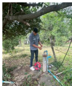
บ้านขับประดู่