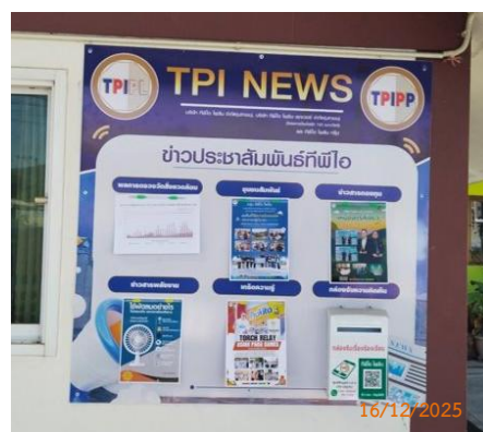
บ้านผู้ใหญ่ หมู่ 10 ต.ทับทิม ที่ทำการผู้ใหญ่บ้าน ม.10