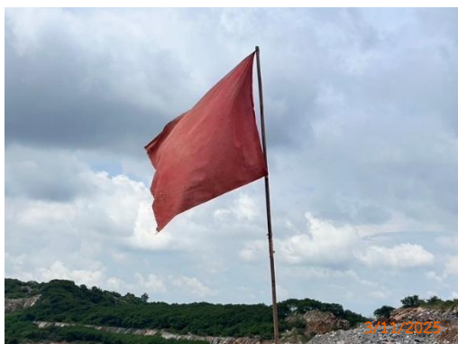
รูปที่ 2-4 ธงแสดงตำแหน่งหลุมเจาะ