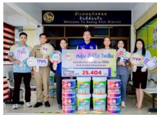
รูปที่ 2-22 สนับสนุนกิจกรรมชุมชน