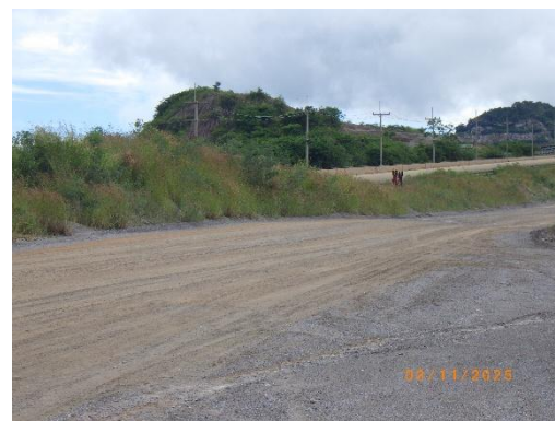
รูปที่ 2-42 การเก็บกวาดเศษหินและเศษดิน บริเวณด้านบนของหน้าระเบิด