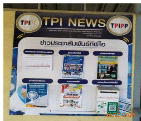
บ้านผู้ใหญ่ หมู่ 5 ต.มวกเหล็ก วัดหินลับ