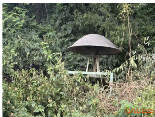
รูปที่ 2-3 สัญญาณเตือนก่อนทำการระเบิด