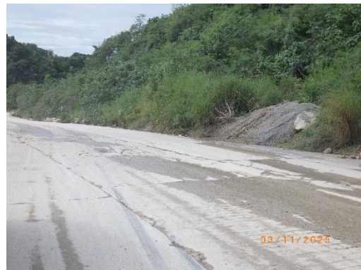
รูปที่ 2-32 ถนนคอนกรีตเสริมเหล็ก บริเวณเส้นทางขนส่งหลัก