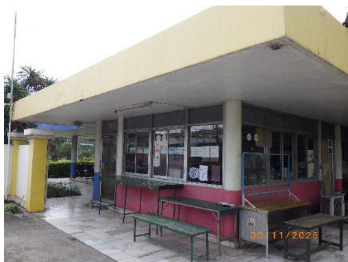
รูปที่ 2-21 อาคารติดต่อและรับเรื่องราวร้องทุกข์ ของบริษัทฯ

ของบริษัท ทีพีโอ โพลีน จำกัด (มหาชน) ระหว่างเดือนกรกฎาคม-ธันวาคม พ.ศ. 2568