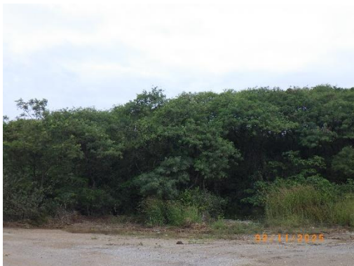
รูปที่ 2-25 ปกป้องไม้ยืนต้นโตเร็ว ประจำถิ่นเพิ่มเติม