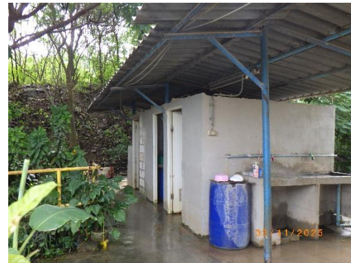
รูปที่ 2-17 ห้องน้ำภายในบริเวณโครงการ