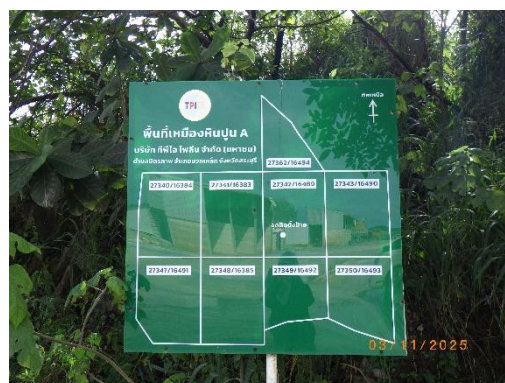
รูปที่ 2-7 ป้ายแสดงแนวขอบเขตการทำเหมือง