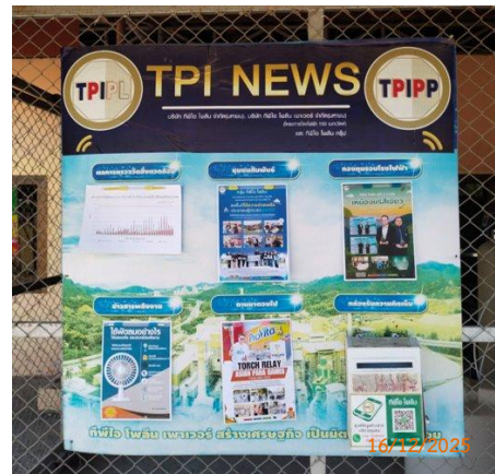
ศาลาประชาคม หมู่ 2 ต.ท่าคล้อ