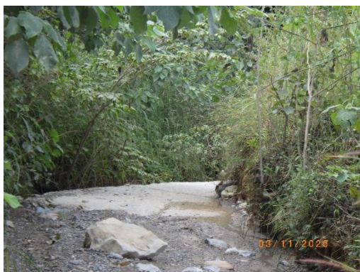
รูปที่ 2-39 คูระบายน้ำ บริเวณพื้นที่โครงการ

ของบริษัท ทีพีโอ โพลีน จำกัด (มหาชน) ระหว่างเดือนกรกฎาคม-ธันวาคม พ.ศ. 2568