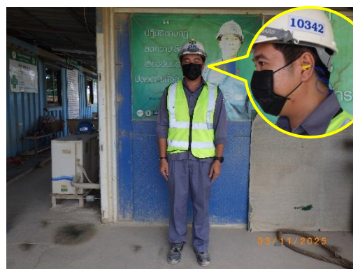
รูปที่ 2-14 การสวมใส่อุปกรณ์ป้องกันอันตราย ส่วนบุคคลของพนักงาน