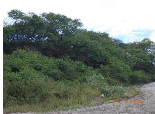
รูปที่ 2-9 แนวต้นไม้ ในแนวเขตเว้นการทำเหมือง