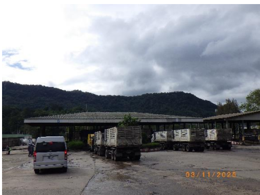
รูปที่ 2-33 เครื่องชั่งน้ำหนัก บริเวณประตูที่ 3