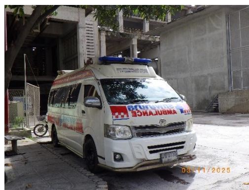
รูปที่ 2-15 ห้องพยาบาลและรถพยาบาลฉุกเฉิน