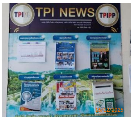
ศาลาประชาคม หมู่ 4 ต.มิตรภาพ