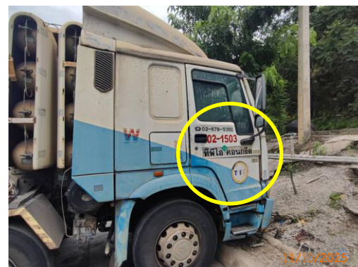
รูปที่ 2-38 เบอร์โทรศัพท์ หรือรายละเอียด ที่สามารถแจ้งข้อร้องเรียนที่เห็นชัดเจน ข้างรถบรรทุกแร่ของโครงการ