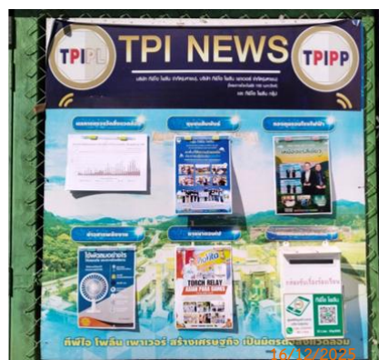
ศาลาประชาคม หมู่ 10 ต.มิตรภาพ