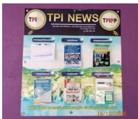
ศาลาประชาคม หมู่ 7 ต.มิตรภาพ