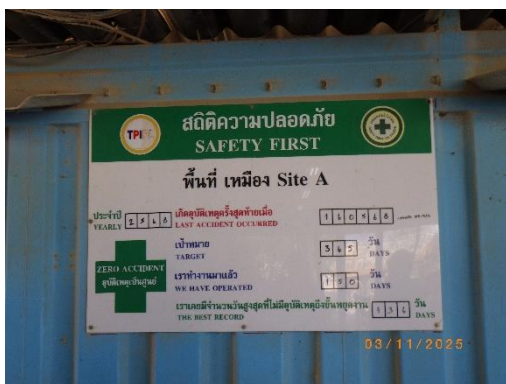
รูปที่ 2-18 ประกาศด้านความปลอดภัย ในพื้นที่เหมือง