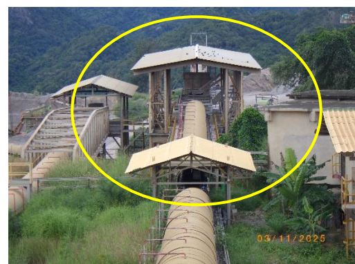
รูปที่ 2-28 ระบบ Bag Filter จุดถ่ายโอนต่างๆของสายพานลำเลียง