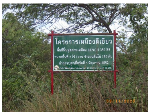
รูปที่ 2-10 โครงการฟื้นฟูเหมือง (ในแนวเขตแนวการทำเหมือง)