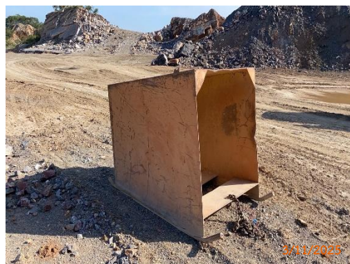
รูปที่ 2-5 ที่กำบังในการหลบขณะระเบิด