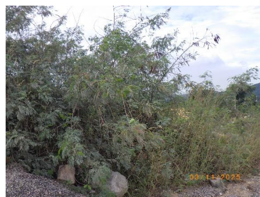
รูปที่ 2-44 ไม้คลุมดินบริเวณพื้นที่โครงการ