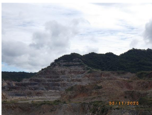
รูปที่ 2-2 ลักษณะการทำเหมืองแบบขั้นบันได เหมืองแร่หินปูน