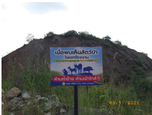
รูปที่ 2-46 ป้ายเตือนพบเห็นสัตว์ป่าในพื้นที่โครงการ