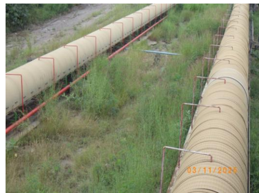
รูปที่ 2-47 ระบบ Springer ในบริเวณถนนเส้นทางขนส่งลำเลียงหิน