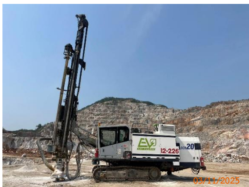
รูปที่ 2-11 เครื่องเจาะรูระเบิด ที่มีระบบ Cyclone และถุกรอง

ของบริษัท ทีพีโอ โพลีน จำกัด (มหาชน) ระหว่างเดือนกรกฎาคม-ธันวาคม พ.ศ. 2568