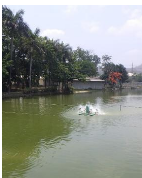
บ่อน้ำใช้สำหรับโครงการ