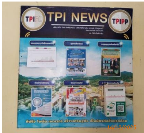
วัดชัยประดิษฐ์ หมู่ 6 ต.มวกเหล็ก วัดชัยประดิษฐ์

ของบริษัท ทีพีโอ โพลีน จำกัด (มหาชน) ระหว่างเดือนกรกฎาคม-ธันวาคม พ.ศ. 2568