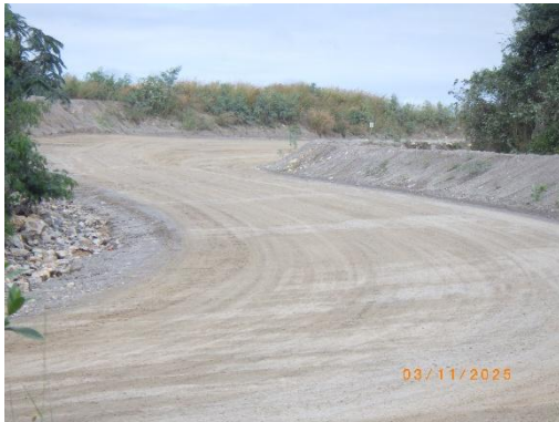
รูปที่ 2-23 ใช้ประโยชน์มูลดินในการปรับปรุง ไหล่ทาง และเส้นทางบริเวณหน้าเหมือง