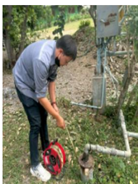
บ้านเขมะกอก