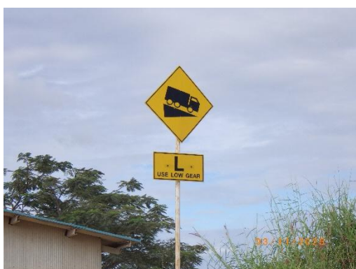
รูปที่ 2-43 ป้ายชะลอความเร็ว