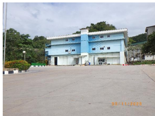
รูปที่ 2-34 ลานจอดรถบรรทุก บริเวณโรงงานปูนซีเมนต์