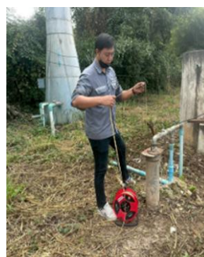
บ้านหินลับ