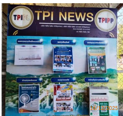
ศาลาประชคม หมู่ 5 ต.มิตรภาพ