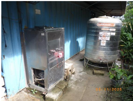
รูปที่ 2-16 ถังสำรองน้ำดื่มในพื้นที่สำนักงาน

ของบริษัท ทีพีโอ โพลีน จำกัด (มหาชน) ระหว่างเดือนกรกฎาคม-ธันวาคม พ.ศ. 2568