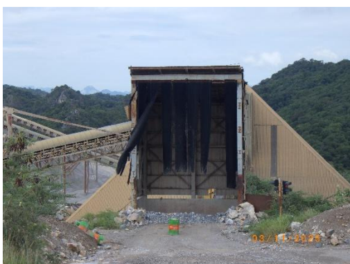
รูปที่ 2-27 เครื่องย่อยหินปูน (Limestone Crusher)