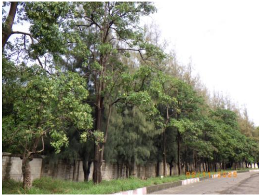
รูปที่ 2-29 ปุ่มไม้ยืนต้นขนาดใหญ่ บริเวณขอบเขตพื้นที่โครงการที่ต่อเนื่องกับ โรงเรียนบ้านชัยบอน

ของบริษัท ทีพีโอ โพลิน จำกัด (มหาชน) ระหว่างเดือนกรกฎาคม-ธันวาคม พ.ศ. 2568