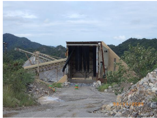
รูปที่ 2-30 เครื่องฉีดพ่นน้ำในลักษณะของม่านน้ำ บริเวณลานกองวัตถุดิบ