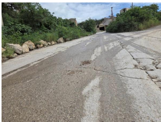
รูปที่ 2-49 พื้นคอนกรีตเสริมเหล็กบริเวณลานหน้าอาคาร โรงโม่บดและย่อยหิน (limestone crusher #1)

ของบริษัท ทีพีโอ โพลิน จำกัด (มหาชน) ระหว่างเดือนกรกฎาคม-ธันวาคม พ.ศ. 2568