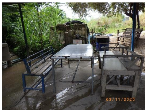
รูปที่ 2-20 บริเวณพักผ่อนสำหรับพนักงาน