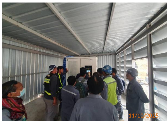
รูปที่ 2-37 การอบรมวิธีการทำงาน ของเครื่องจักรกลและอุปกรณ์แต่ละประเภท ให้แก่พนักงาน