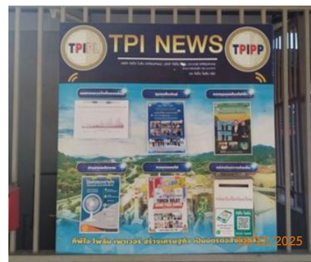
ศาลาประชาคม หมู่ 6 ต.มิตรภาพ