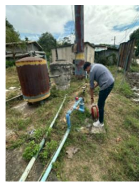
บ้านโสกแถว