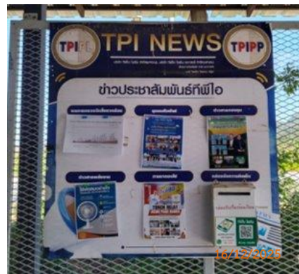
บ้านผู้ใหญ่ หมู่ 3 ต.ทับขาว ที่ทำการผู้ใหญ่บ้าน ม.3