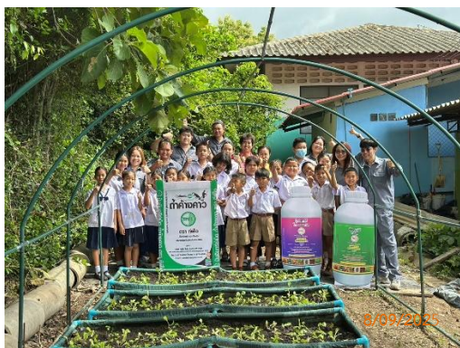
รูปที่ 2-41 สนับสนุนกิจกรรม ภายในโรงเรียนบ้านซับบอน