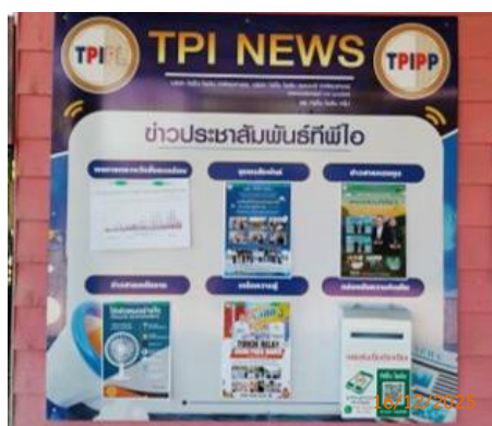
บ้านผู้ใหญ่ หมู่ 12 ต.มวกเหล็ก ที่ทำการผู้ใหญ่บ้าน ม.12