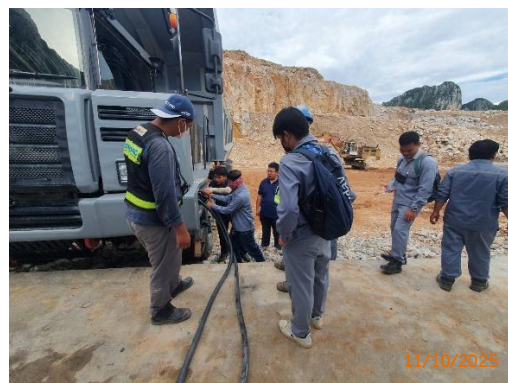
รูปที่ 2-40 การอบรมพนักงานขับรถบรรทุกแร่