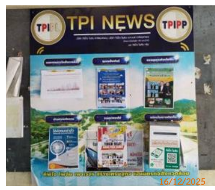
วัดชัยบอน หมู่ 5 ต.ทับกวาง ศาลาชุมชนบ้านชัยบอน