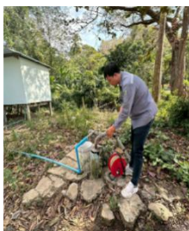
บ้านถ้ำสะพานหิน