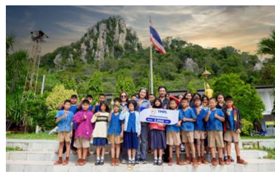
รูปที่ 2-22 (ต่อ) สนับสนุนกิจกรรมชุมชน