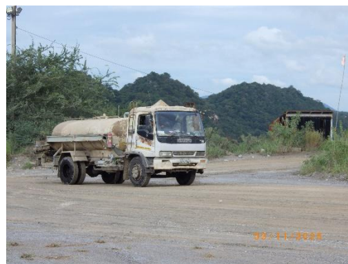
รูปที่ 2-12 การฉีดพรมน้ำบริเวณเส้นทางขนส่งแร่