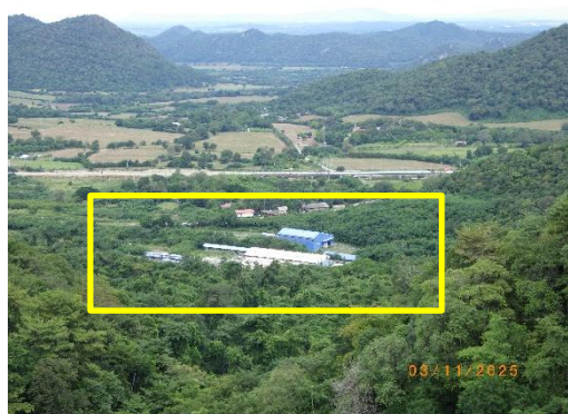
รูปที่ 2-8 ขอบเขตสุดท้ายของหน้าเหมือง ห่างจากเส้นทางรถไฟสายตะวันออกเฉียงเหนือ