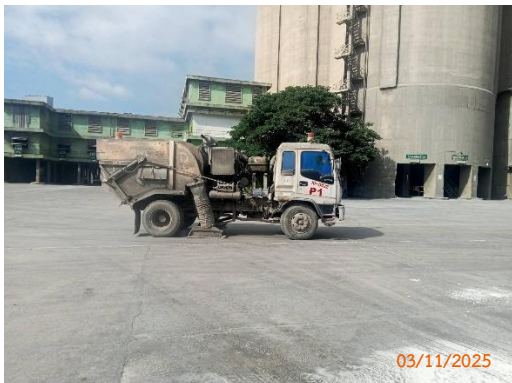
รูปที่ 2-31 รถดูดฝุ่นทำความสะอาดฝุ่น บริเวณพื้นที่โครงการ