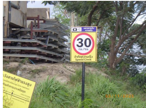
รูปที่ 2-24 ป้ายควบคุมความเร็ว บริเวณพื้นที่โครงการ