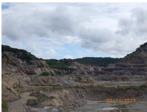
รูปที่ 2-1 สภาพหน้าเหมืองแร่หินปูน