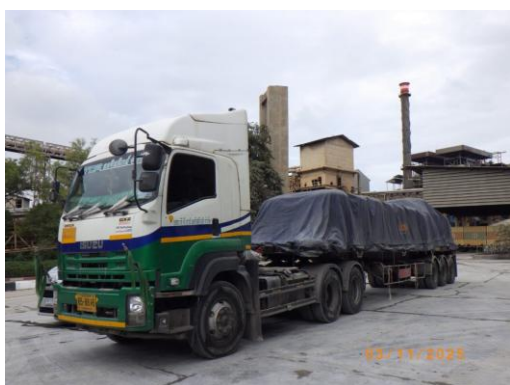
รูปที่ 2-13 ผ้าใบปิดคลุมรถขณะขนส่งแร่