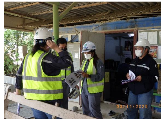
รูปที่ 2-26 การติดตามตรวจสอบตามมาตรการ ป้องกันและแก้ไขผลกระทบสิ่งแวดล้อม